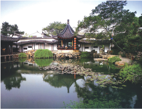
ნახ. 7.1.3. აღმოსავლეთი აზია. იაპონია

რად იქნება გათვალისწინებული ფიზიკურ-გეოგრაფიული, ისტორიულ-პოლიტიკური, სოციალურ-ეკონომიკური, ეთნოკულტურული და რელიგიურ-ცივილიზაციური ფაქტორები, საკმაოდ რთული ამოცანაა. ამიტომ არის, რომ სხვადასხვა წიგნებსა თუ სახელმძღვანელოებში მსოფლიოს რეგიონებად დაყოფის სულ სხვადასხვა სქემებს ვხვდებით. წინამდებარე სახელმძღვანელოში გამოყოფილია მსოფლიოს 15 მთავარი რეგიონი. რეგიონების გამოყოფის ძირითადი კრიტერიუმი იყო ერთმანეთისგან განსხვავება, ხოლო თითოეული მათგანის შიგნით – მსგავსება ფიზიკურ-გეოგრაფიული პირობების, ეკონომიკური მაჩვენებლების, ისტორიულ-პოლიტიკური განვითარების, მოსახლეობის ეროვნული და რელიგიური შემადგენლობის, კულტურული და ცივილიზაციური კუთვნილების მიხედვით. ცხადია, ყველა კრიტერიუმის თანაბრად გათვალისწინება შეუძლებელია, მაგრამ აუცილებელია, რომ რეგიონი ტერიტორიულად ერთიანი, უწყვეტი იყოს. ამის გამო ერთსა და იმავე გეოგრაფიულ რეგიონში შეიძლება ეკონომიკურად და კულტურულად ერთმანეთისგან სრულიად განსხვავებული ქვეყნები მოხვდნენ.