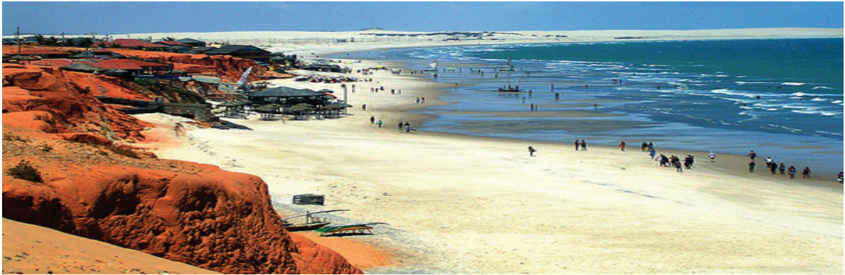
ნახ. 7.16. ლათინური ამერიკა. ბრაზილიის სანაპირო

ბუდისტურ, დაოსისტურ-კონფუციანისტურ და სინტოისტურ სამყაროს მიეკუთვნება და მთელი რიგი თავისებურებებით ხასიათდება.