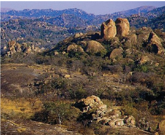
ნახ. 7.15. საუნები. ზიმბაბუე. აფრიკა

6. სამხრეთ-აღმოსავლეთი ევროპა აერთიანებს ბალკანეთისა და ადრიატიკის სახელმწიფოებს (რუმინეთი, ბულგარეთი, საბერძნეთი, ალბანეთი, ყოფილი იუგოსლავიის ქვეყნები), რომელთაგან ყველა (საბერძნეთის გარდა) სოციალისტური სისტემის ნაწილი იყო. მიუხედავად ლინგვისტური სხვაობისა (სლავური, რომანული, ბერძნული და ალბანური ენობრივი ჯგუფები), რეგიონის ხალხებისთვის დამახასიათებელია ისტორიული ბედის მსგავსება, ხოლო მათი