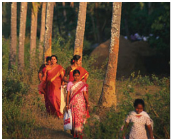
ნახ. 7.1.4. სამხრეთი აზია. ინდოელები

2. დასავლეთი ევროპა, როგორც რეგიონი, რამდენიმე მნიშვნელობით მოიაზრება. XX საუკუნის 50-80-იან წლებში ევროპის ყველა სოციალისტურ ქვეყანას აღმოსავლეთ ევროპას მიაკუთვნებდნენ, ხოლო ყველა კაპიტალისტურს – დასავლეთ ევროპას. არსებობდა დასავლეთ ევროპის სხვა გაგებაც, სადაც ამ ცნებაში დასავლეთი და ცენტრალური ევროპის კაპიტალისტური ქვეყნები იგულისხმებოდა, ჩრდილოეთ ევროპის (სკანდინავიის) და სამხრეთ ევროპის (ესპანეთი, პორტუგალია, იტალია, საბერძნეთი) გამოკლებით. წინამდებარე წიგნში დასავლეთი ევროპა განიხილება მისი ვიწრო მნიშვნელობით, რომელიც ამჟამად ყველაზე უფრო მიღებულია და ბრიტანეთის კუნძულებს, საფრანგეთსა და ბენილუქსის ქვეყნებს აერთიანებს.