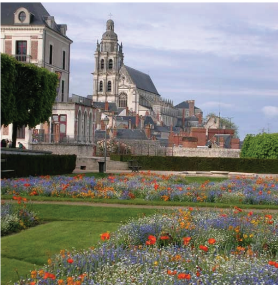
ნახ. 7.1.1. დასავლეთი ვეროპა. საფრანგეთი

მსოფლიოს დაყოფა დიდ რეგიონებად, სადაც გამოყოფის კრიტერიუმებში კომპლექსუ-