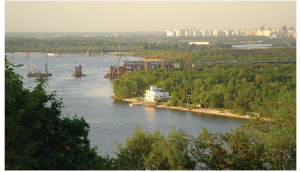
ნახ. 7.1.2. აღმოსავლეთი ვეროპა. უკრაინა

დედამიწის ტაქსონომიურად ყველაზე ზედა კომპლექსური რაიონები მსოფლიო ხმელეთი და მსოფლიო ოკეანეა. მსოფლიო ხმელეთის დაყოფა მომდევნო ტაქსონომიური დონეების